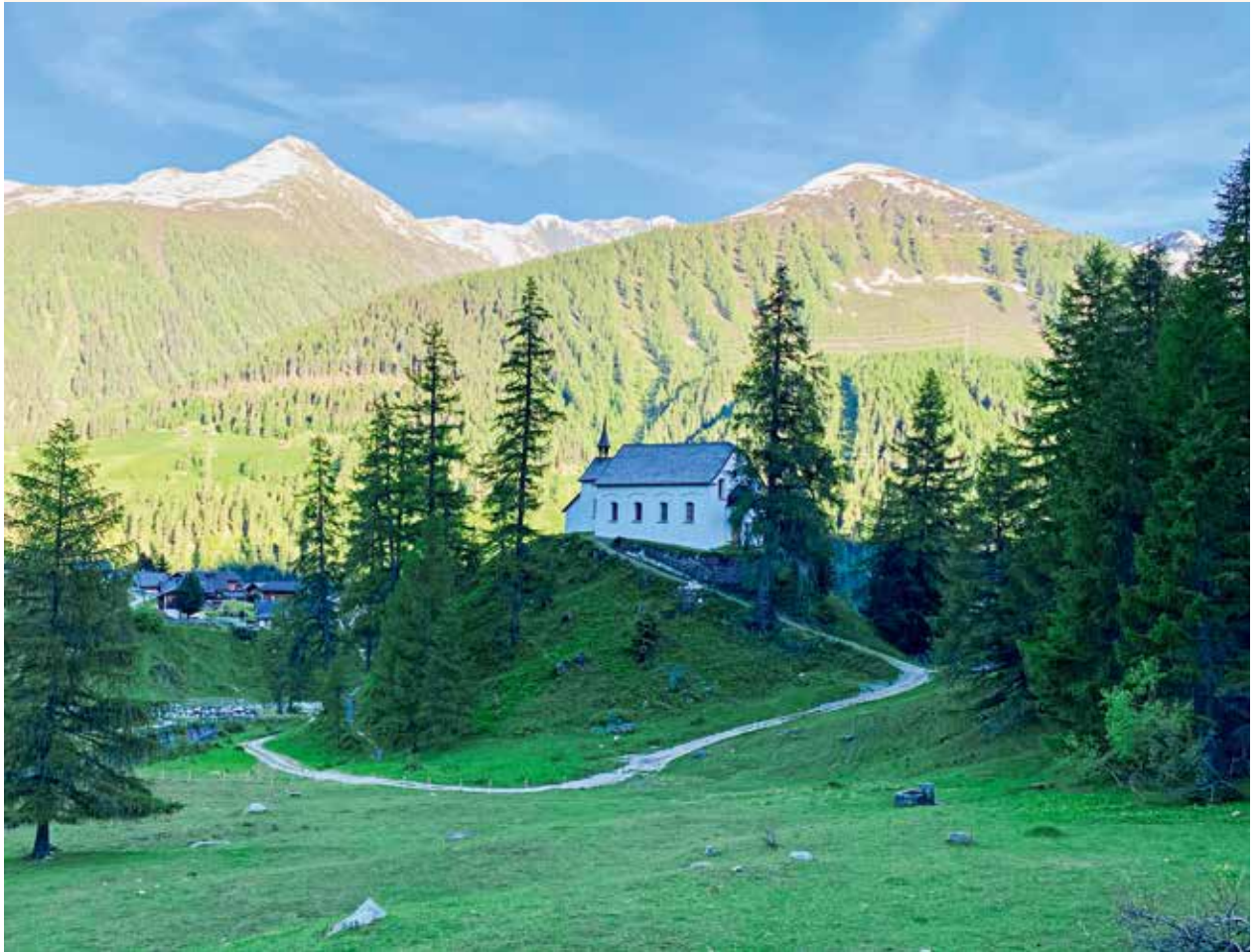
St. Antonius Kapelle