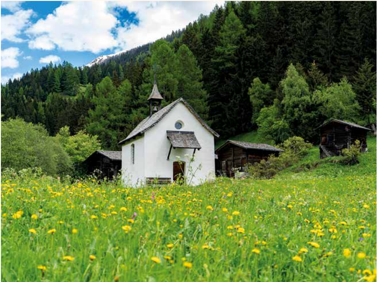
Nothelferkapelle St. Sebastian, Niederwald